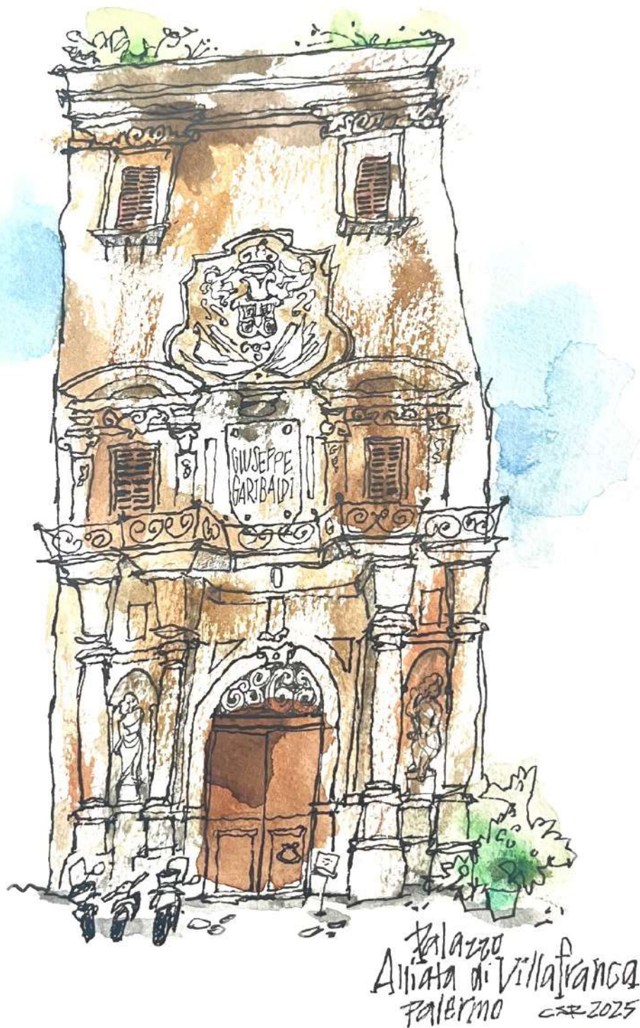
Palazzo Alliata di Villafranca Palermo 2025